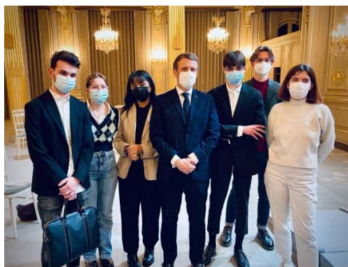
Rencontre du Président avec les boursiers 2021

Invitation à un événement avec le Président de la République.