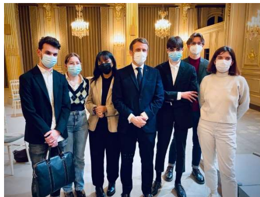
Rencontre du Président avec les boursiers 2021

Invitation à un événement avec le Président de la République.